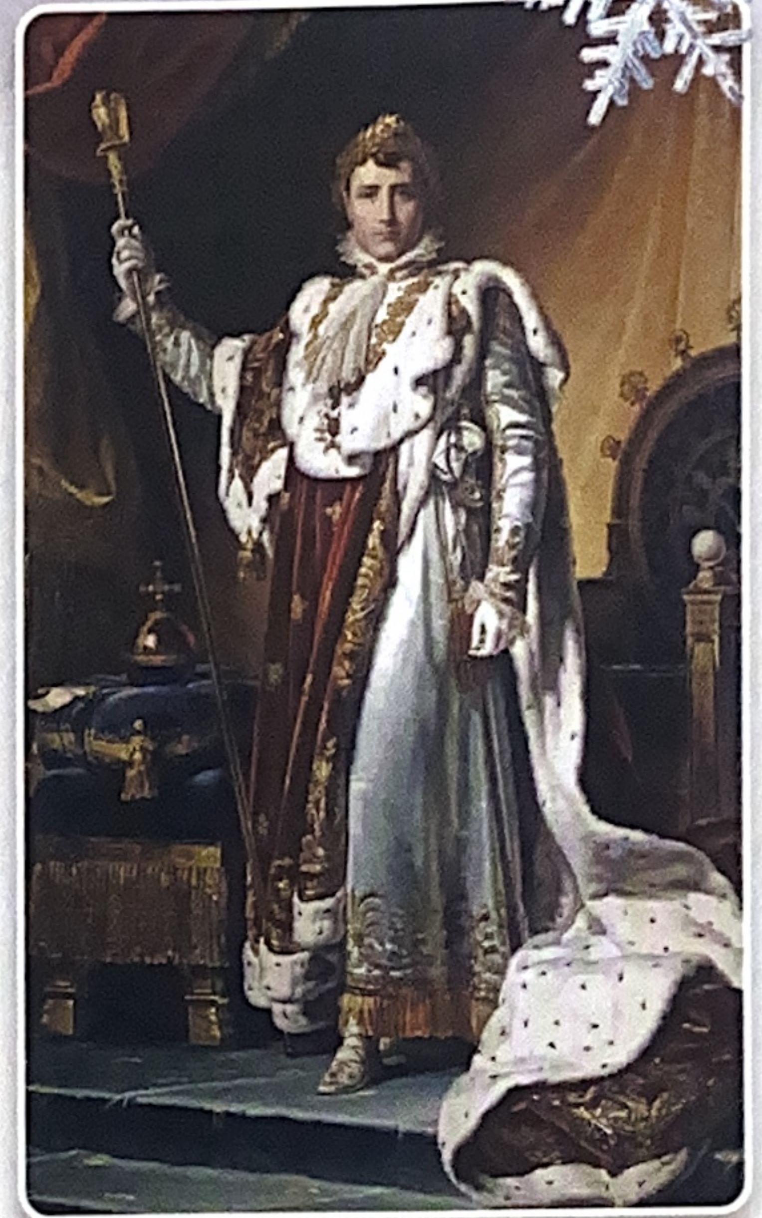
Cesarski plašč Napoleona I. je bil izdelan iz hermelinovega krzna.

LETOŠNJA ZIMSKA MODA MI JE ZELO VŠEČ! UPAM, DA SE BO SNEG OBDRŽAL.