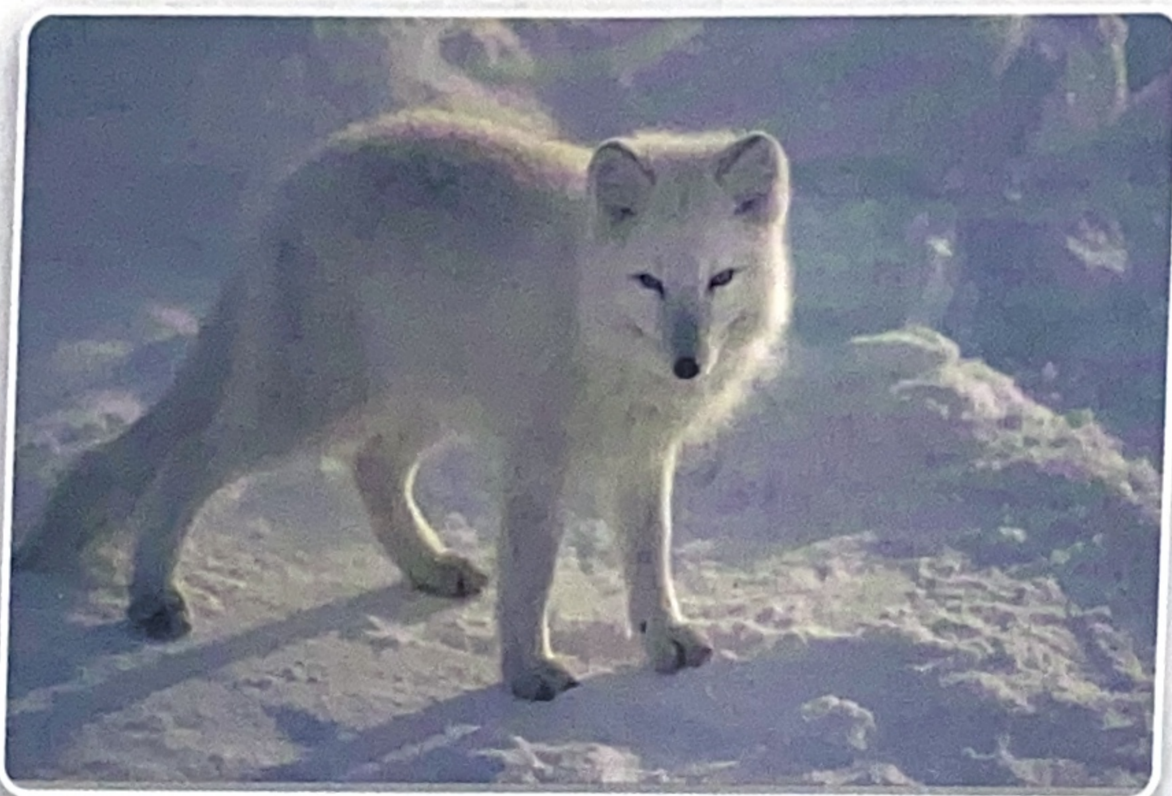
Pred mrzlo arktično zimo arktično lisico varujejo gost bel kožuh, kratki uhlji, kratek gobček in zimske dlake tudi na podplatih.

perje. Ujeti zrak v zračnih žepih tik ob telesu jim pomaga zadržati toploto. Bel kožuh pa je tudi debelejši; nekaterim živalim v severnih tundrah zrastejo pozimi tudi dodatne dlake na tacah.