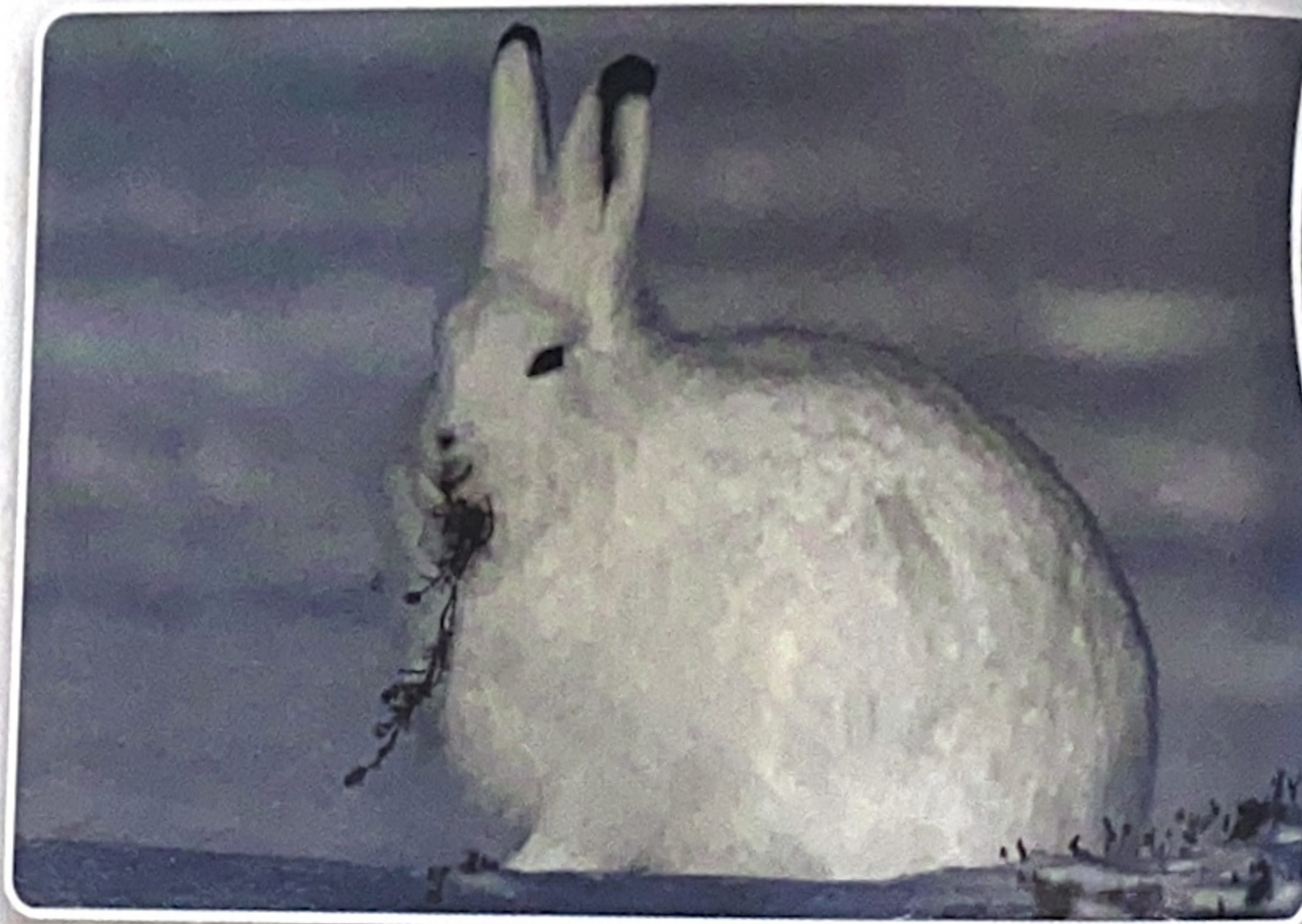
Poleti se arktični zajci hranijo z jagodami, listi in koreninami, pozimi pa z lubjem dreves ter mahovi in lišaji, ki jih izkopavajo izpod snega.